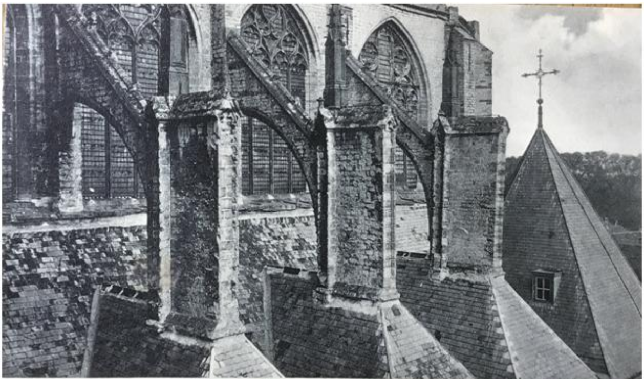
Fragment Hervormde Kerk. Goes