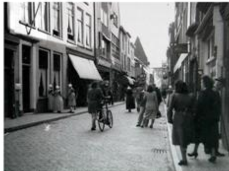
De Lange Kerkstraat in 1952. Voor no. 16 staan een drietal vrouwen in dagelijkse kledetracht