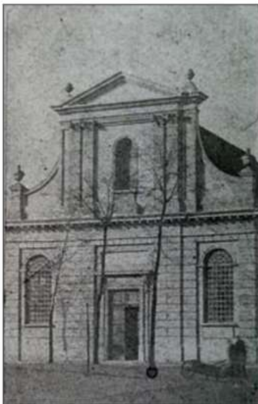
Situatie vanaf 1815. Tekening