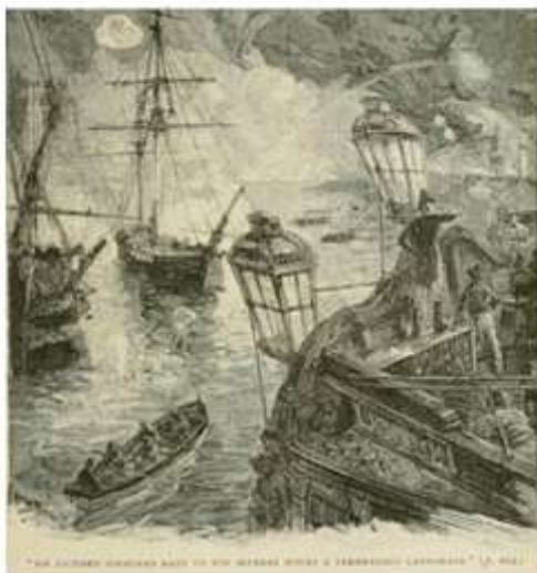
De beschieting van Vlissingen op 14 augustus 1809 door de Britse vloot onder leiding van Sir Richard Strachan.