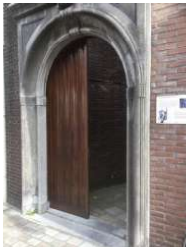
Poortje van de voormalige Gasthuiskerk te Goes.